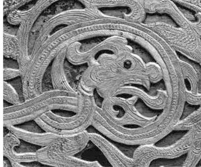
藤ノ木古墳出土 龍文飾り金具(部分)【国宝】