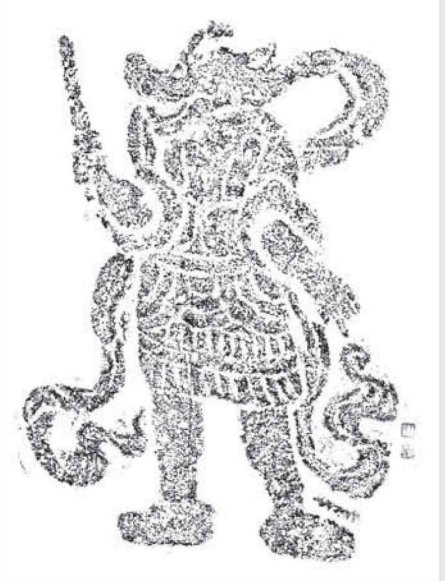
伝真徳王陵十二支像辰辰 拓本