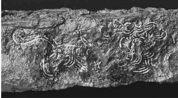
新沢327号墳出土 龍文象嵌大刀

「十二支のたつ」、「龍の出現と到来」、「龍文様の展開」、「四神の龍」、「文字で記された龍」の5部構成とし、龍と十二支との関係、龍の出現と日本列島へ到来し描かれた龍の姿、さまざまな器物に表現された龍の姿、四神としての龍、文字で記された龍などの考古資料を中心に紹介します。